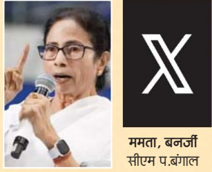
ममता, बनर्जी सीएम प.बंगाल

केंद्र सरकार और निर्वचन आयोग मतदाता सूचियों के एसआईआर का इस्तेमाल 2026 के विधानसभा चुनाव से पहले बंगाल के लाखों पात्र मतदाताओं के नाम गैरकानूनी तरीके से हटाने के लिए कर रहे हैं। अगर मतदाता सूचियों के विशेष गहन पुनरीक्षण (एसआईआर) के दौरान एक भी पात्र मतदाता का नाम हटाया गया, तो हम अनिश्चितकालीन धरने पर बैठेंगे।