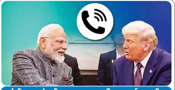
मोदी-ट्रम्प के बीच इस साल छठी बार हुई बातचीत

नई दिल्ली/वाशिंगटन, जेएनएन। प्रधानमंत्री नरेंद्र मोदी ने अमेरिकी राष्ट्रपति ट्रंप से फोन पर बातचीत की है। उन्होंने सोशल मीडिया पर पोस्ट कर इसकी जानकारी शेयर की। मोदी ने कहा कि उनकी बातचीत गर्मजोशी भरी और सकारात्मक रही। उन्होंने बताया कि क्षेत्रीय तथा अंतरराष्ट्रीय मुद्दों पर भी चर्चा की। भारत और अमेरिका वैश्विक शांति, स्थिरता और समृद्धि के लिए मिलकर काम करते रहेंगे। बातचीत में दोनों देशों के बीच व्यापार बढ़ाने की जरूरत पर जोर दिया गया। साथ ही अहम तकनीक, ऊर्जा, रक्षा और सुरक्षा जैसे क्षेत्रों में साझेदारी को आगे बढ़ाने पर भी सहमति बनी। मोदी और ट्रंप के बीच छठी बार फोन पर चर्चा