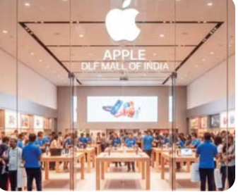
ऑफ इंडिया के ग्रांड फ्लोर पर 8,240 वर्ग फुट जगह ली है। लीज का पहला साल रेंट-फ्री रहेगा। इससे हर महीने करीब 45 लाख रुपए और सालाना लगभग 5 करोड़ रुपए से

नोएडा सेक्टर-18 स्थित डीएलएफ मॉल ऑफ इंडिया में खोला गया एपल स्टोर खास तौर पर युवाओं को ध्यान में रखकर बनाया गया है, क्योंकि नोएडा एक ऐसा शहर है, जहां देश के कई हिस्सों से लोग काम और नौकरी के लिए रहते हैं। यहां यूपी और दिल्ली के अलावा बिहार, उत्तराखंड, झारखंड और बंगाल से भी लोग बसे हुए हैं। शहर में युवा आबादी अच्छी-खासी है, जो आईटी और अन्य कंपनियों में काम कर रही है। इसलिए स्टोर युवाओं को एपल के प्रोडक्ट्स से जोड़ने और उन्हें कंपनी के करीब लाने में मदद कर सकता है।