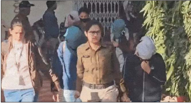
पुलिस ने युवतियों को भी हिरासत में लिया।