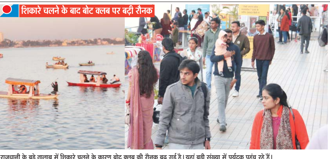
राजधानी के बड़े तालाब में शिकारे चलने के कारण बोट क्लब पर बढ़ी रौनक